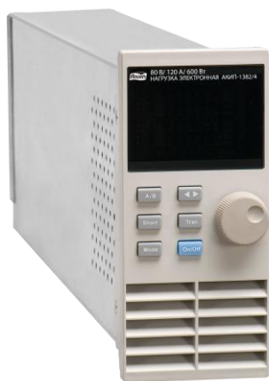
АКИП-1382/4 (модуль для установки в шасси)