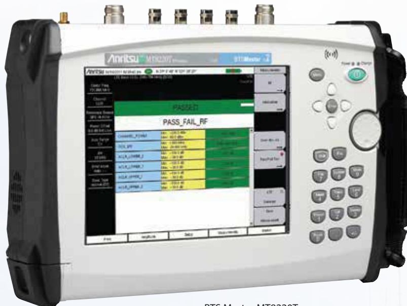
BTS Master MT8220T

Нужны измерения мощности с большей точностью?