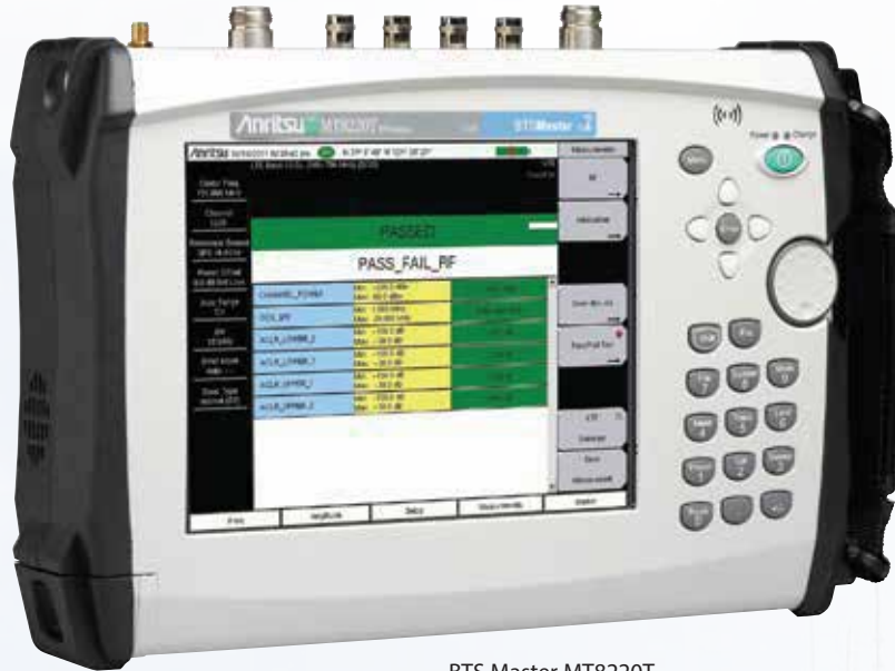
BTS Master MT8220T

Нужны измерения мощности с большей точностью?