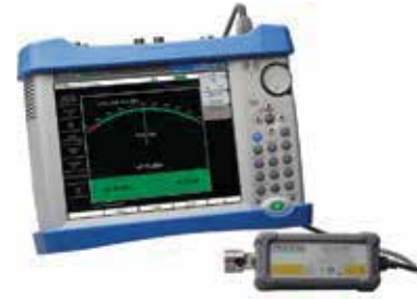
Повышение точности измерения мощности, выполняемого с помощью портативного прибора