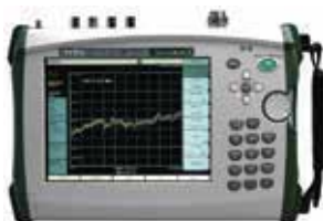
Spectrum Master™ MS2720T