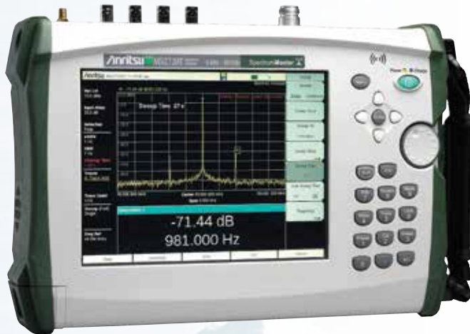
Spectrum Master MS2720T

Нужны измерения мощности с большей точностью?