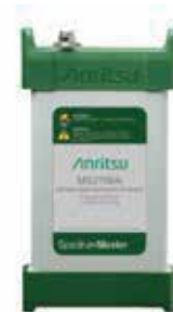
Spectrum Master Ultraportable MS276xA