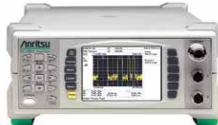
Измеритель импульсной мощности ML2496A