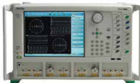
VectorStar™ MS4640B Vector Network Analyzer