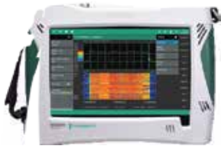
Field Master™ MS2090A