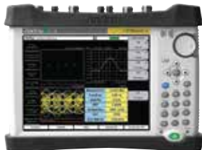
LMR Master™ S412E