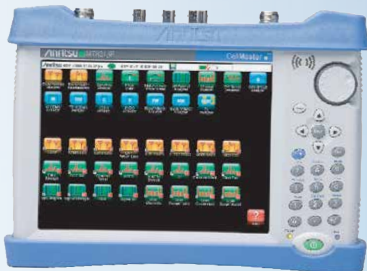
Cell Master MT8213E

Нужны измерения мощности с большей точностью?