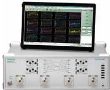
ShockLine™ Vector Network Analyzer MS46524B