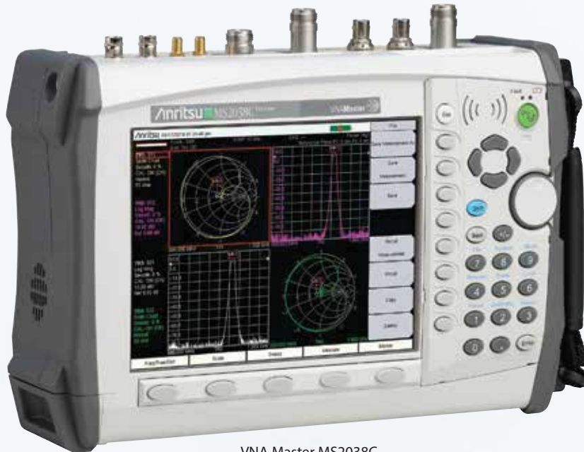
VNA Master MS2038C

Нужны измерения мощности с большей точностью?