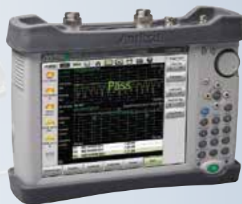
Site Master S820E

Эти прочные, легкие и простые в использовании приборы имеют высокую производительность, пригодность к работе в полевых условиях, надежность и точность приборов лабораторного уровня и размер, который позволяет им уместиться на ладони и работать везде, где требуются измерения в СВЧ-диапазоне или тестирование систем связи.