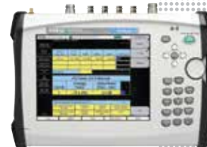
BTS Master™ MT8220T