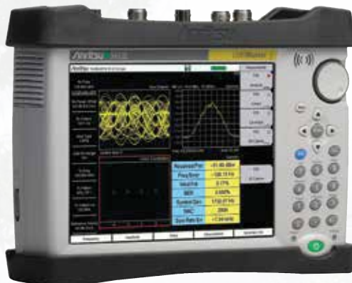
LMR Master S412E

Нужны измерения мощности с большей точностью?