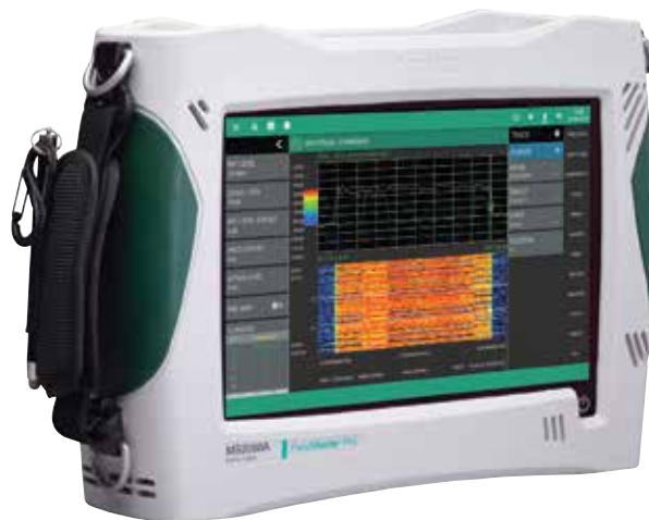
Field Master Pro™ MS2090A