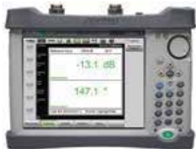
Site Master™ S820E