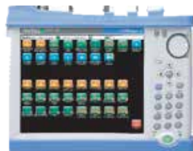
Cell Master MT8213E