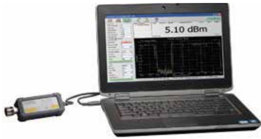
Управление датчиком с помощью ПО PowerXpert™