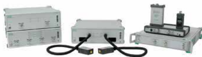
Векторные анализаторы цепей ShockLine