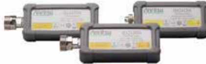
Датчики мощности в СВЧ-диапазоне с подключением по USB