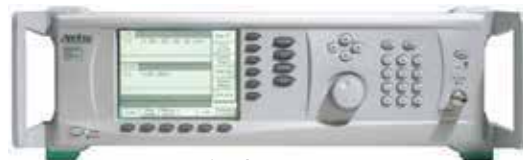
Signal Generator MG3697C