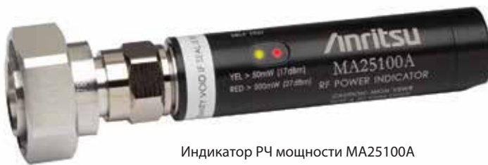
Индикатор РЧ мощности MA25100A