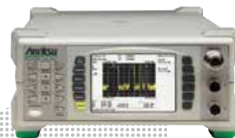
Pulse Power Meter ML2496A