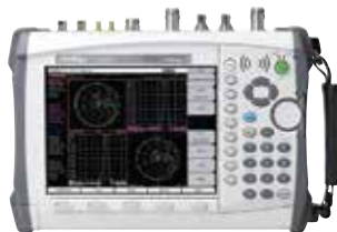
VNA Master™ MS2038C