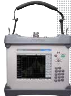
PIM Master™ MW82119B