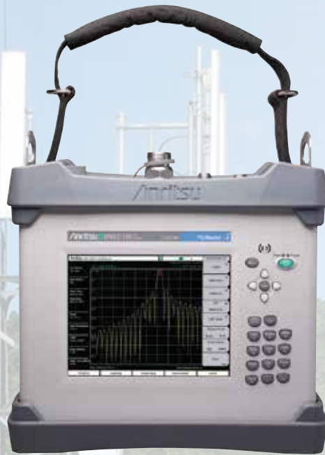
PIM Master MW82119B

Нужны измерения мощности с большей точностью?