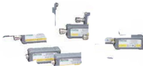
USB Power Sensors MA243X0A