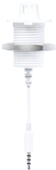
Рисунок 2.1 – Зонд S-TN для измерений температуры и относительной влажности