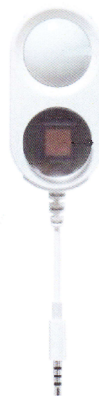
Рисунок 2.3 – Зонд S-Lux UV для измерений освещенности и энергетической освещенности