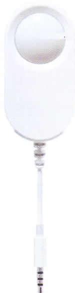
Рисунок 2.2 – Зонд S-Lux для измерений освещенности