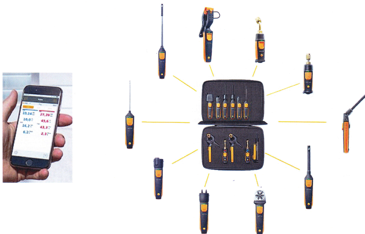
Рисунок 2 – Комплект измерительный «Смарт-зонды Testo»