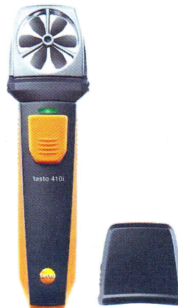
Смарт-зонд Testo 410i