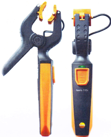
Смарт-зонд Testo 115i