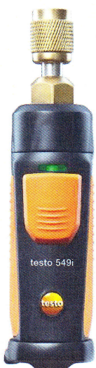
Смарт-зонд Testo 549i