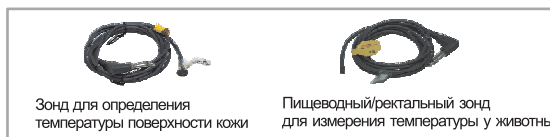
Зонд для определения температуры поверхности кожи

Ток возбуждения : постоянный ток 100 мкА Датчик : термистор 2252Ом@25°C Диапазон : 32°C~42°C Чувствительность : 0.1°C