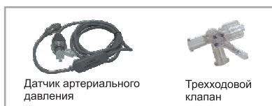
Датчик артериального давления

Максимальное входное давление : 300 мм рт. ст. Отклик на верхней частоте : 0.1 Гц или 1 Гц Отклик на нижней частоте : 40 Гц или 100 Гц Отклик на частоте режекции : 50/ 60 Гц Коэффициент подавления синфазного сигнала : 85 дБ минимум