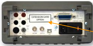
Внешний вид задней панели (B7-78/1)

Интерфейс GPIB (КОП) или RS-232, 10 кан./ 20 кан. сканер для B7-78/1