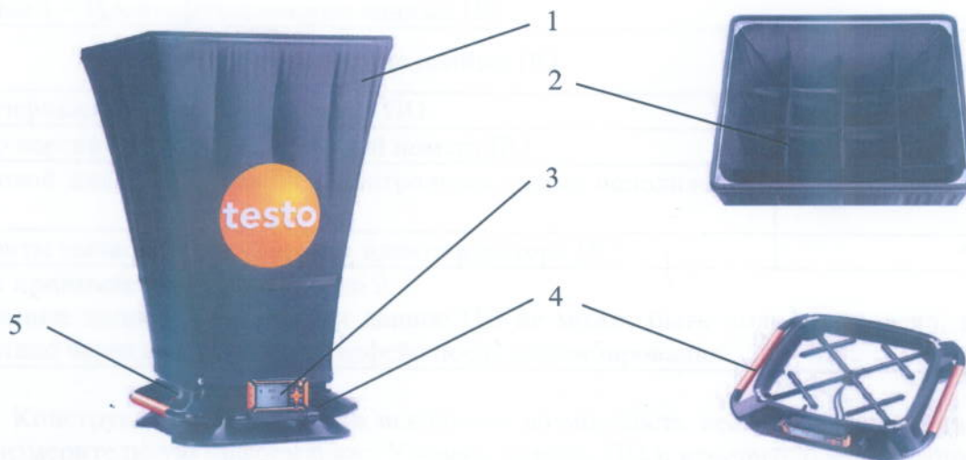
Рисунок 1 – Общий вид расходомера и его основания

Расходомер состоит из конфузора (1) - для измерения объемного расхода воздуха со встроенным выпрямителем воздуха (2), измерительного прибора Testo 420 с датчиками (3) - для измерений абсолютного давления и разности давлений, основания (4) - с приемниками давлений, и выключателя (5) - для измерений вручную.